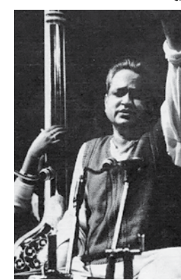
आई पिया संग. आपण सुख कर आ म्हणतो कारण 'आ'वर सम येते.

कुमारजी शाळेत गेले नव्हते, परंतु त्यांनी स्वतःला सुजाण संपन्न बनवलं होतं वाचनानु. शब्दांपलीकडचे समजल्याने